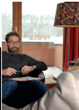
Klinisch- psychologische Diagnostik als Teil der Abklärung