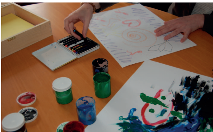
Im Bereich der arbeitsdiagnostischen Abklärung

Für die Menschen, die an unserer Arbeitsdiagnostischen Abklärung teilnehmen, fallen keine Kosten an. Die finanzielle Absicherung während der Teilnahme an der Abklärung ist durch das AMS NÖ gegeben.