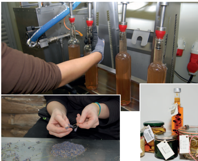
Arbeit an Maschinen und Produktherstellung