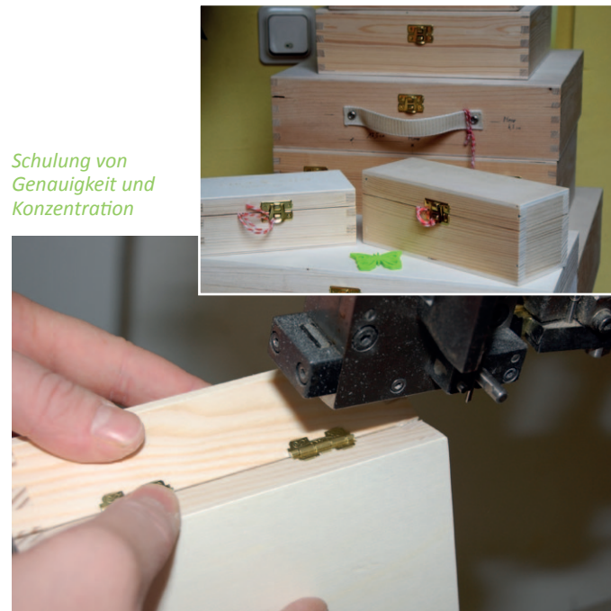
Schulung von Genauigkeit und Konzentration

Erforderlich für die Teilnahme sind psychische Stabilität und die Motivation, an sich selbst und den persönlichen beruflichen Fähigkeiten zu arbeiten. Sind diese grundlegenden Voraussetzungen erfüllt, kann um die Aufnahme ins Trainingsprogramm angesucht werden.