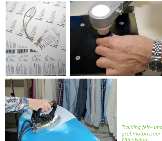
Training fein- und grobmotorischer Fähigkeiten

Die TeilnehmerInnen des ATZ leisten eine aktive Mitarbeit in einem unserer Arbeitsbereiche. Eine finanzielle Absicherung während der Teilnahme am Arbeitstraining gewährleisten das AMS NÖ und die Pensionsversicherungsanstalt NÖ.